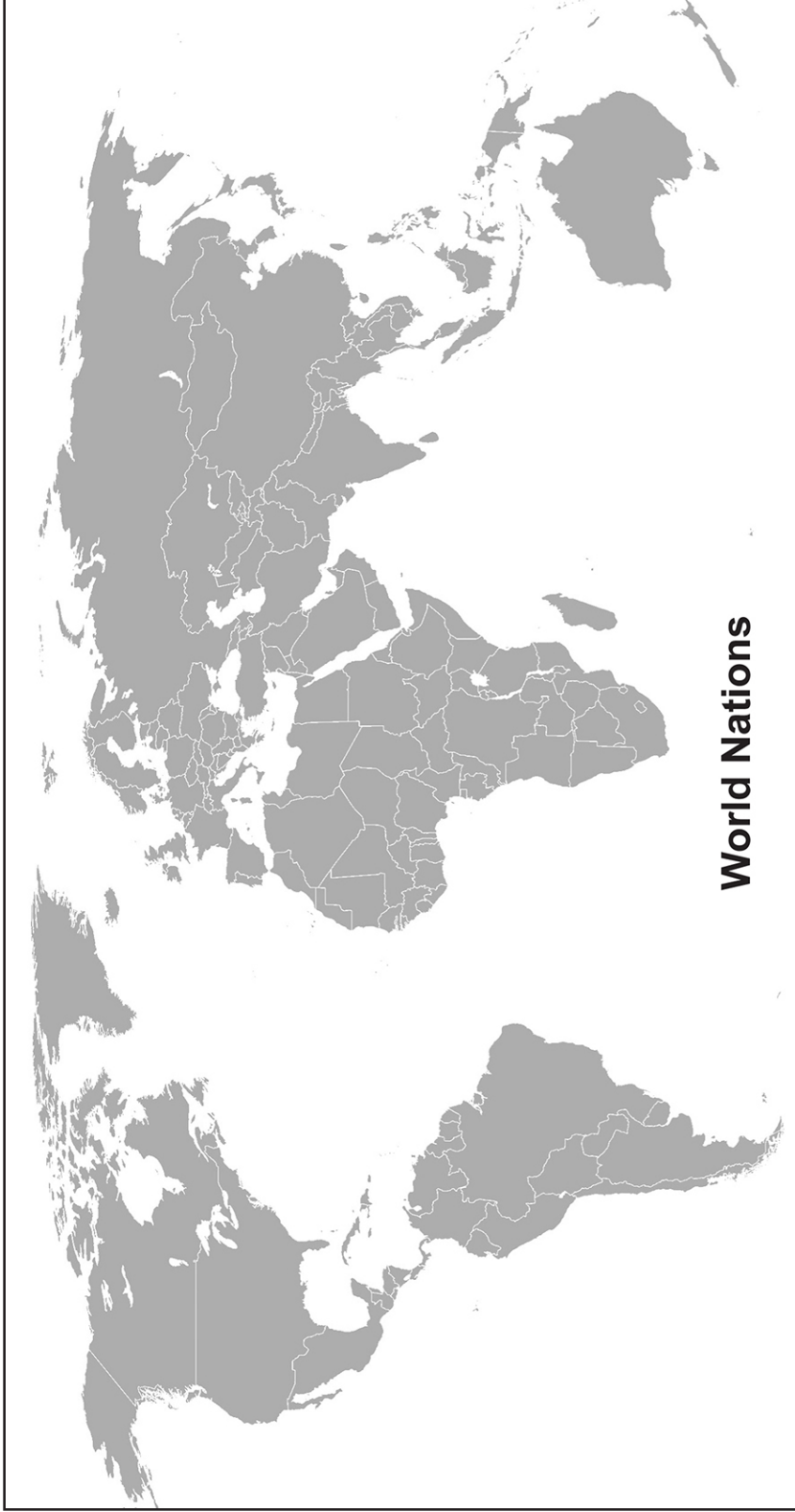
Rumal ri' jix chitzijoj ri utz laj tzij chike konojel ri winaq rech ri uwachulew, chib'ana kiasana' pa ri ub'i' ri Tataxel, K'ojolaxel xuquje' ri Tyoxalaj Uxlab'ixel. - Mateo 28:19